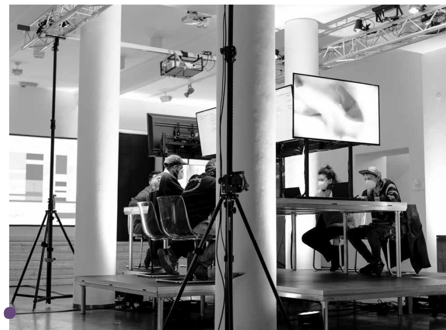
SEX (W. Ziemiński, Terén)

V zhruba 75 minut trvající události je tak divácky mnohem zajímavější dění, které vybočuje z vytyčených hranic události. Každý úsměv na tváři performerera nebo vzájemné šeptání si něčeho do ucha narušuje strohé a povětšinou neatraktivní dění. V tomto směru se diváci dostávají do pozice voyerů,