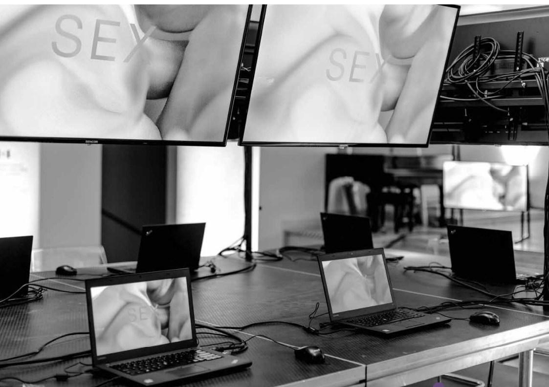
SEX (W. Ziemiński, Terén)

Jedná se o silně konceptuální záležitost. Celý večer je sice strukturovaný do čtyř aktů, jejichž název se vždy vztahuje k tématu sexu, v tomto směru lze mluvit o konceptu, který za výstavbou celého projektu stojí. Ale samotné texty, které performéři živě vytvářejí, se k tématu vážou velice volně – vlastně vůbec nejde o to, co jednotliví performéři píšou. Víc než o uměleckou tvorbu jde o pouhou produkci materie. Středem zájmu